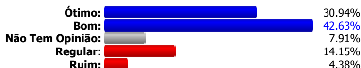
Gráfico de Respostas